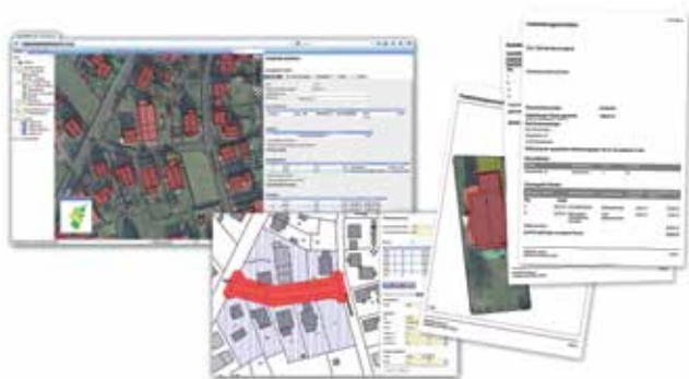
Abb.: Tiefenbegrenzung und Reporterstellung in INGRADA web

„Geodaten und Geografische Informationssysteme liefern eine verlässliche und belastbare Basis für eine sichere Gebühren- und Beitragsberechnung im Sinne des neuen KAG!“