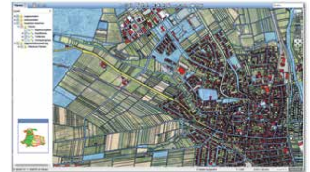
Abb.: Analyse und Auswertungen durch thematische Pläne

Der INGRADA Reportmanager ermöglicht die Erstellung sowohl vordefinierter als auch individueller Reporte für die Datenausgabe wie zum Beispiel den Versand von Erhebungsbögen oder Feststellungsbescheiden. Die integrierte Ausstanzfunktion sorgt für die gezielte grafische Ausgabe einzelner Objekte ohne Darstellung der Nachbarschaften.